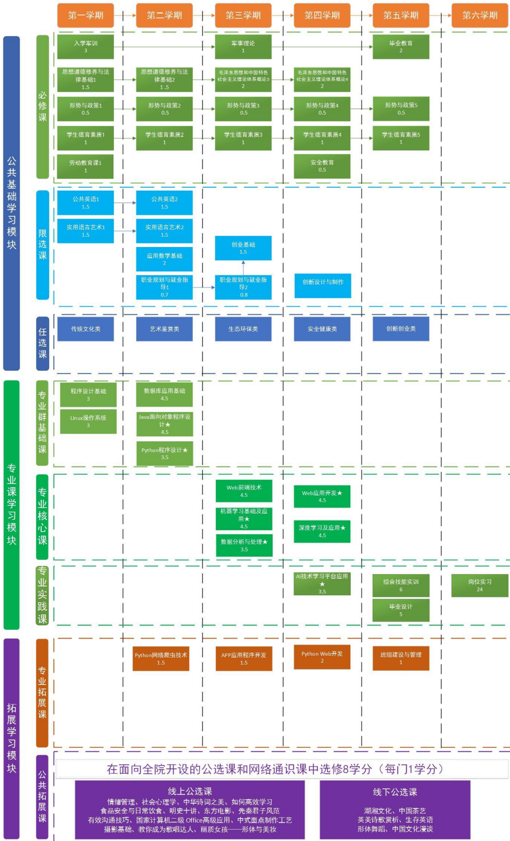
图 1 人工智能专业课程体系图