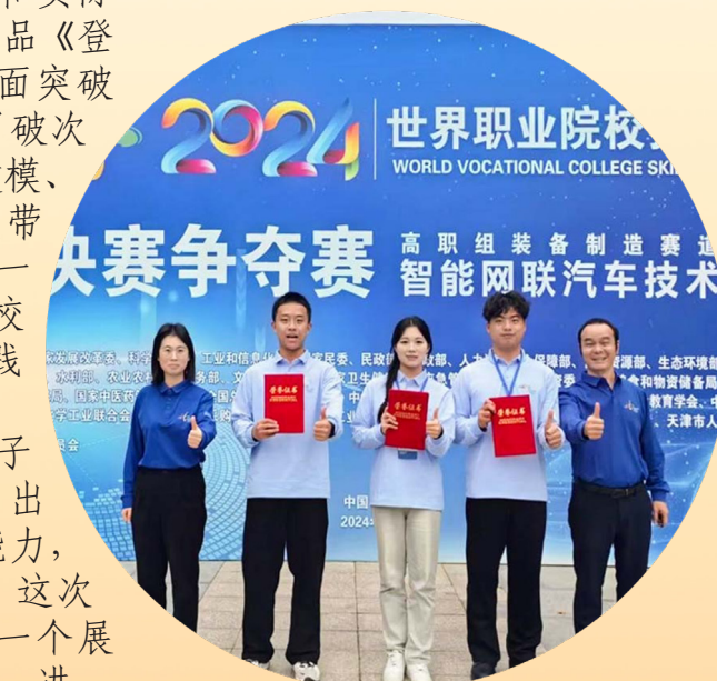
作者：张波 张洁 周诗尧

此次大赛中，学校学子展现出了扎实的专业技能、出色的团队协作精神和创新能力，为学校赢得了荣誉。同时，这次比赛也为学校师生提供了一个展示自我、交流学习平台，进一步推动了学校职业教育的发展。